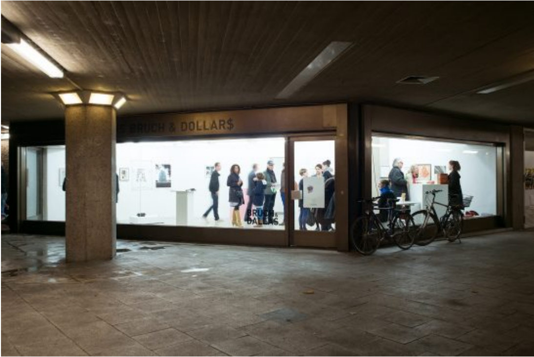
Bruch & Dallas