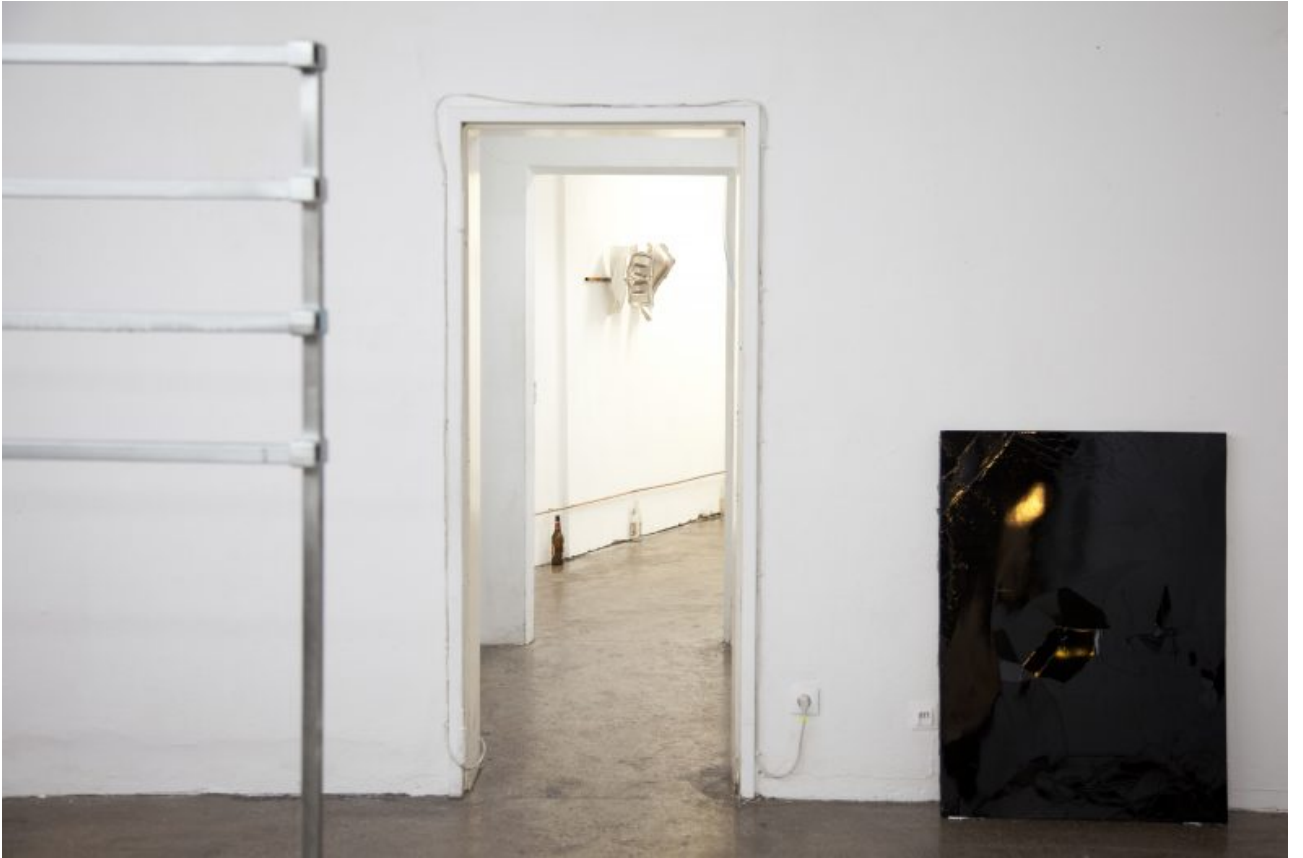
GOLD + BETON