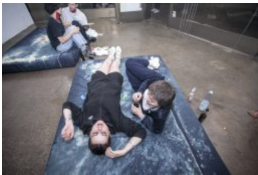
GOLD + BETON